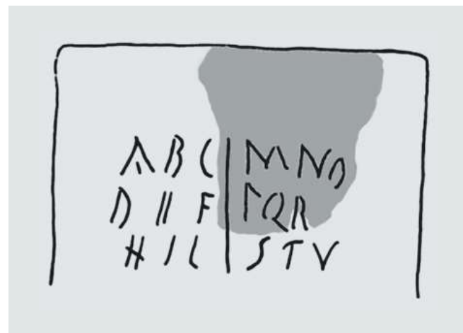
15.4 · Reconstrução do abecedário.

Fragmento de placa de Bronze onde pode ler-se [Quoqu]O OB IT FE[cerit sine dolo malo] ou FI[eri poterit sine dolo malo]. Tratar-se-á de uma disposição jurídica relativa a ações feitas sem dolo ou intenção malévola devendo referir-se à atividade de um magistrado. Há outro fragmento, talvez do mesmo documento, não exposto. A fórmula usada e as características da escrita indicam uma data no período flaviano, tendo as peças sido encontradas na destruição do fórum, onde estariam originalmente colocadas.